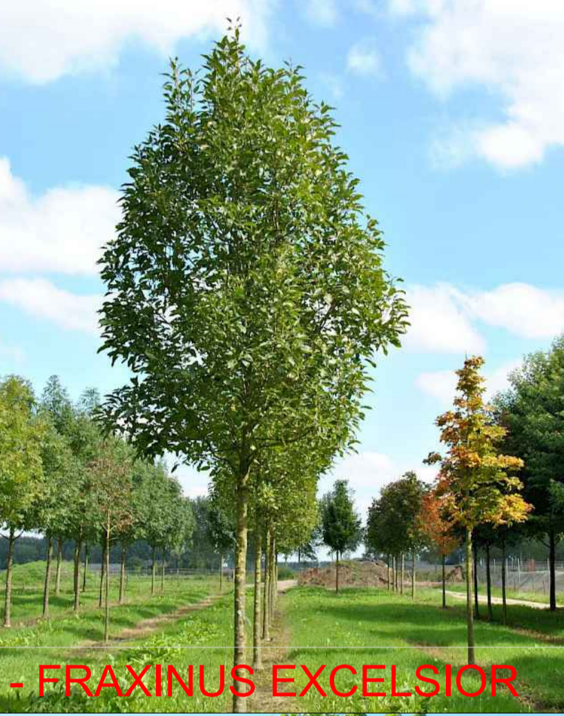
- FRAXINUS EXCELSIOR