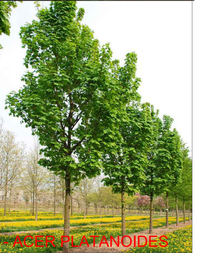
- ACER PLATANOIDES