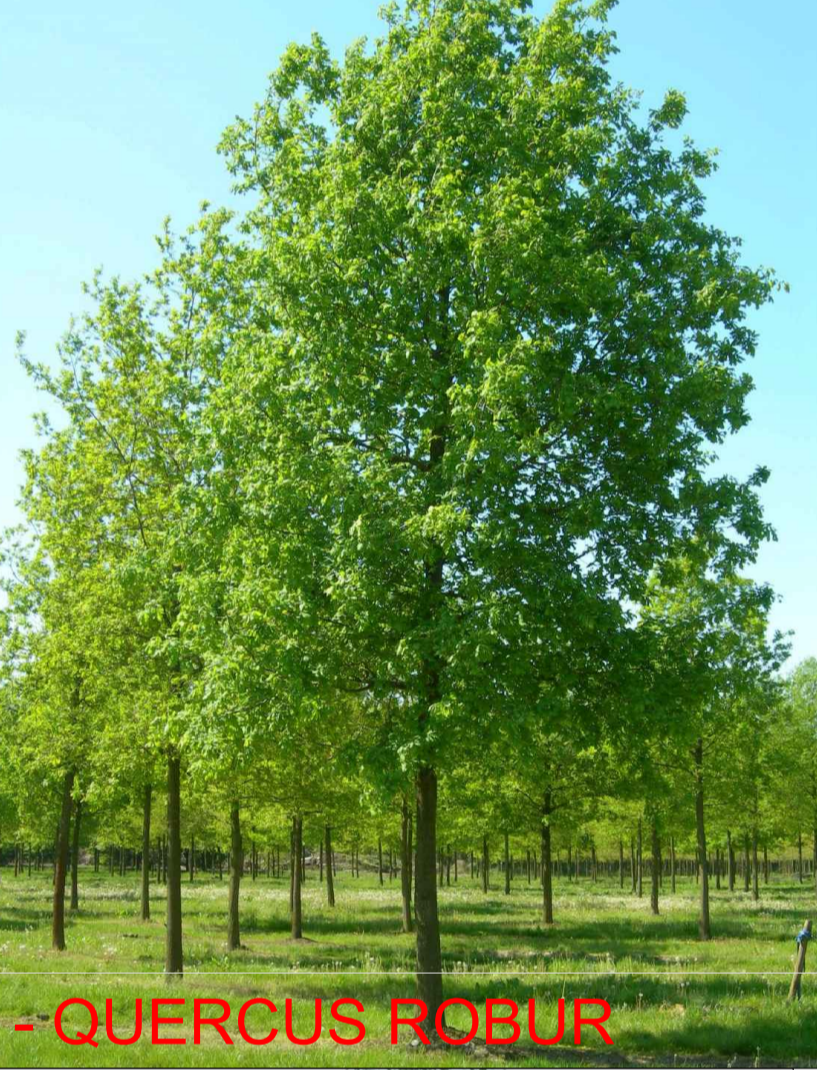
- QUERCUS ROBUR