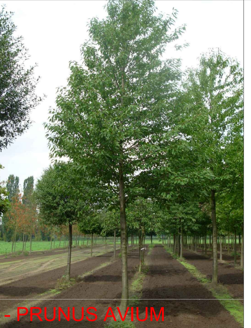
- PRUNUS AVIUM